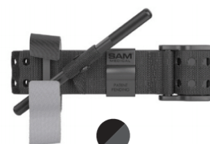
TAKTISCH SCHWARTZ SAM XT-M