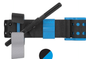
HI-VIZ BLAU SAM XT-B