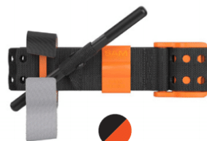
HI-VIZ ORANGE SAM XT-C

SAM ® ist ein eingetragenes Warenzeichen in den USA und anderen Ländern.